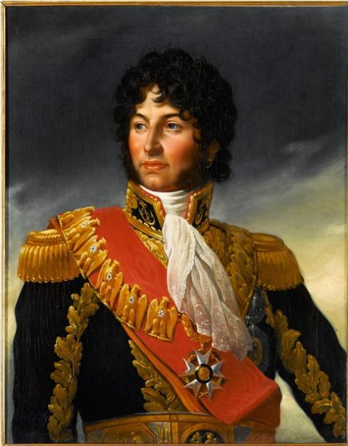
Français : Maréchal Joachim Murat